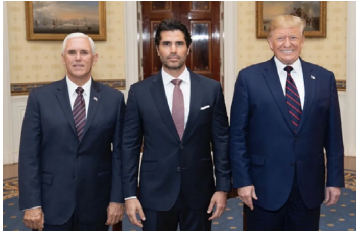
La polémica foto de eduardo verástegui y donald trump | La Opción de Chihuahua (laopcion.com.mx)