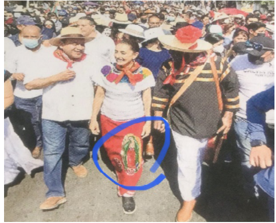
No entiendo la utilización de la imagen de la Virgen de Guadalupe en el inicio de una campaña política de Claudia S. | Joaquín López-Dóriga | Scoopnest CONTRA el Coronavirus, el VALOR de lo SIMBÓLICO - DESDE ABAJO MX

Y es que las mujeres mexicanas son la auténtica mayoría electoral en el presente político del país: Las mujeres son el factor electoral de mayor peso que está decidiendo las elecciones en México, tanto porque son la mayoría numérica en el Padrón y Lista Nominal electoral, como porque se presentan a votar en las casillas más que los varones (10% más), según lo acreditan los estudios oficiales del INE.