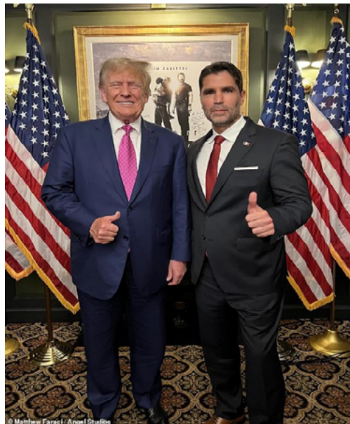
«Has hecho de esta la película más popular del mundo»: Trump felicita a la estrella de Sound of Freedom, Jim Caviezel, durante la proyección de Bedminster después de que los medios liberales intentaran destroz ar una película contra la trata de personas por estar influenciada por QAnon | Daily Mail Online